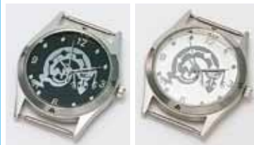
73919 リザード ブラック