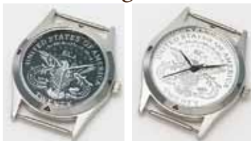
73917 イーグル ブラック