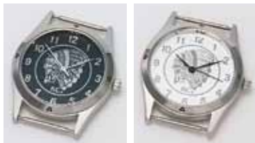
73915 インディアン ブラック