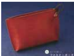
ファスナーポーチ