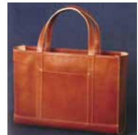
ベーシックトートバッグ