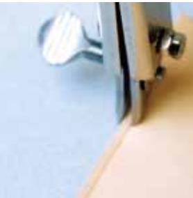
※コテ台付きで安心して仮置きできます