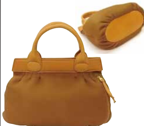
本体<20×29×13> ※一部ミシンをします。

●エルクスキン(大鹿)を使ったバッグ。本体をタックとギャザーで「ふくら」と、懐かしさを感じる手提げバッグを手縫いで作ります。鹿革の温もりを感じて下さい。