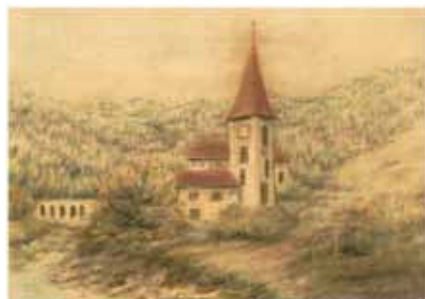
※額付 額サイズ<31×40 (太子)>