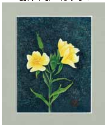
※額付 額サイズ<27×22> 革<15×11>