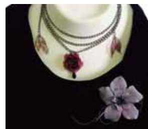
ラリエット チェーン <全長 155> バラ<Φ3>