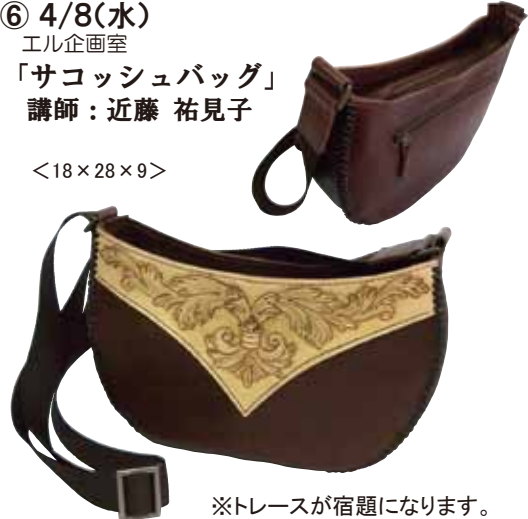
※トレースが宿題になります。

●ポケット感覚で持つ小さめのバッグです。革はイタリア産のアリゾナを使用。手縫いとレースかがりで作っています。補修日もご用意しますので、初心者でも気軽に参加できます。