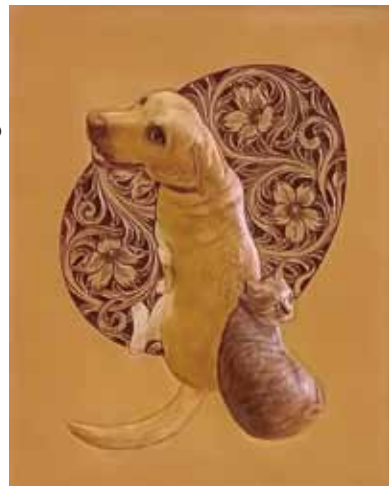
※アートボックスフレーム付き<27.5×22×3.5>

●フィギュアの立体モデリング、犬と猫の生き生きとした表情を描くペインティングの講習です。同一の革に施したシェリダグンカービングは宿題になるので、中級以上の方。シェリダグン未経験者はカービング無し、またはレンガ塀バージョンもご用意します。